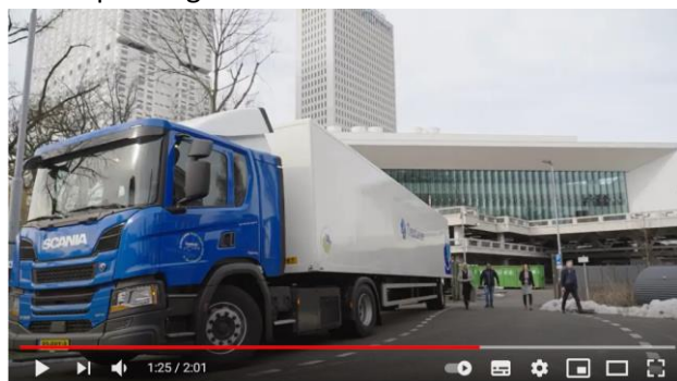
Figuur 4 Video over de inzet van de hybride Scania truck door CleanLease voor Erasmus MC in Rotterdam.