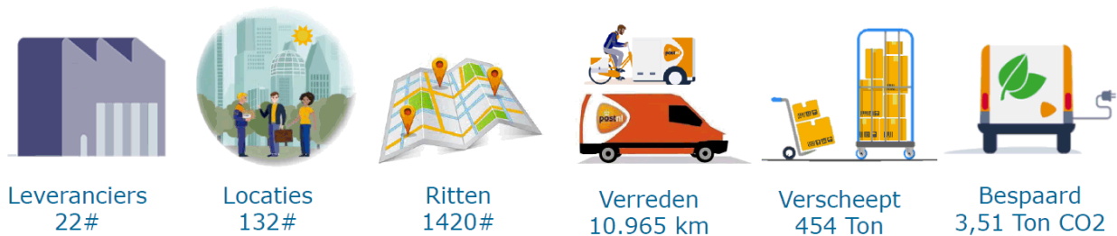
Figuur 3 Cijfers na een jaar Haagse hub