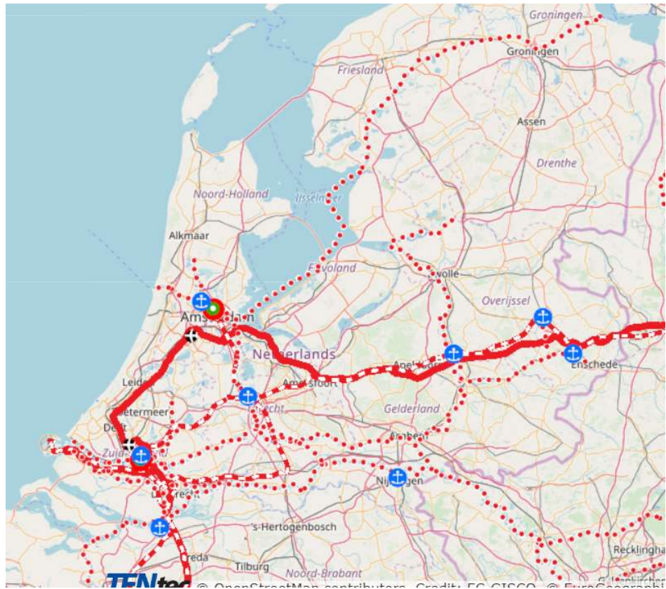
Figuur 2: TEN-T North Sea-Baltic corridor.