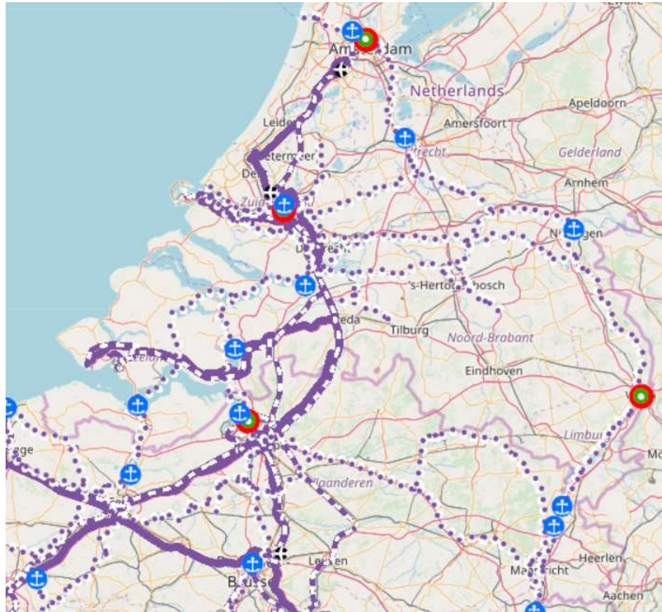
Figuur 4: TEN-T North Sea-Mediterranean corridor.